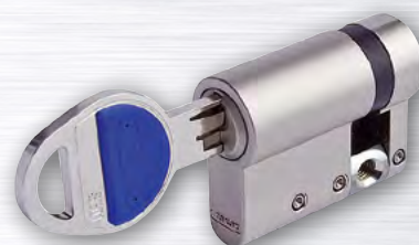
JEDNOSTRANNÁ CYLINDRICKÁ VLOŽKA TOKOZ TECH